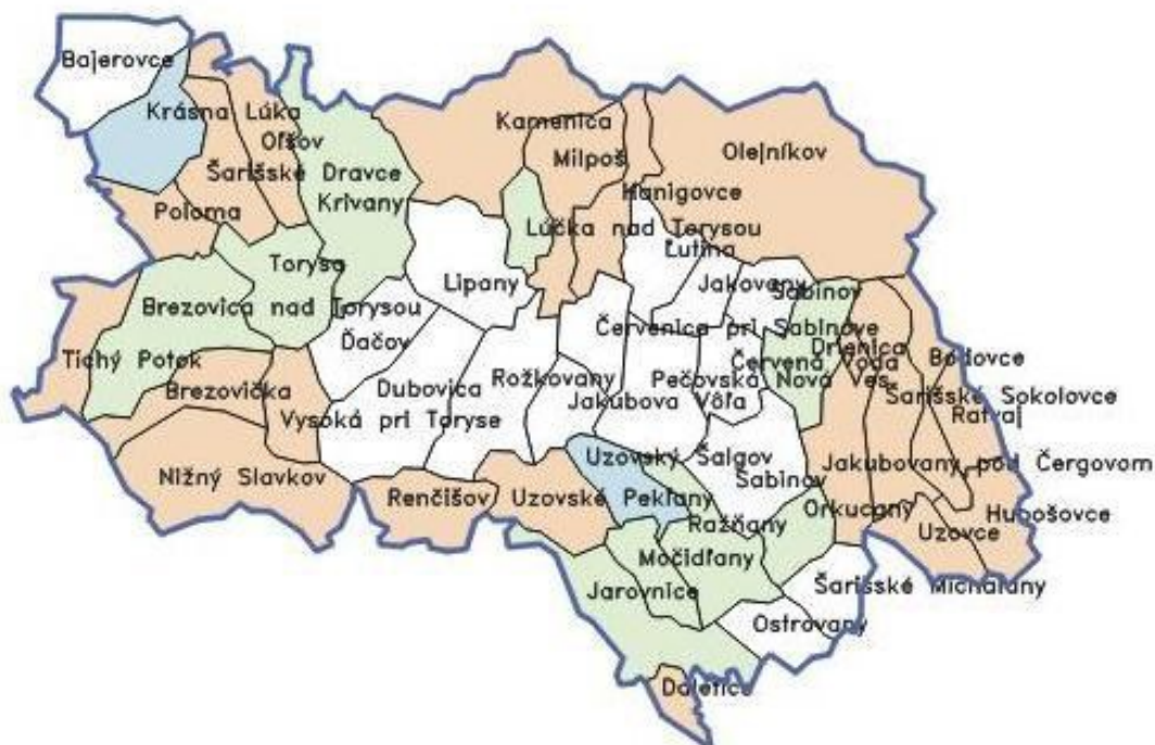
Obrázok č. 1 Geografická poloha obce