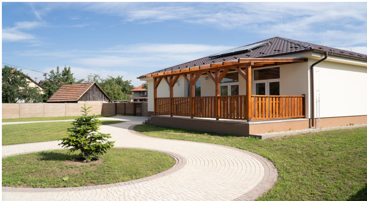
Obrázok č. 3 – Budova denného stacionára

a základnou školou, s miestnymi záujmovými združeniami, dennými stacionármi v okolitých obciach, ako aj s inými zariadeniami a organizáciami podobného zamerania.