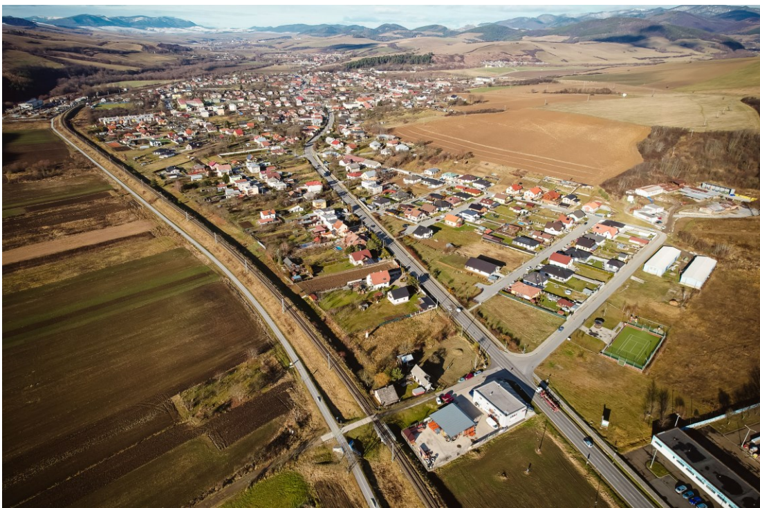
Obrázok č.2 Letecký snímok obce Pečovská Nová Ves

rokov dozadu, zistili by sme , že počet obyvateľov každým rokom narastá. Zatiaľ čo v roku 2018 v obci žilo 2709 občanov, k 31.12.2022 evidujeme k trvalému pobytu v obci prihlásených 2851 obyvateľov. K tomuto postupnému demografickému nárastu výrazným spôsobom prispieva viacero faktorov, od výhodnej geografickej polohy cez lokalizáciu obce na hlavnom ťahu Lipany – Sabinov, s dobrým dopravným spojením až po dostupnosť poskytovaných služieb a stavieb občianskej vybavenosti. Veľký význam pri zvyšovaní populácie má investičná bytová výstavba v novej lokalite Za Majerom, kde vyrástlo 40 rodinných domov. Program rozvoja obce počíta aj s ďalšou výstavbou nájomných bytov.