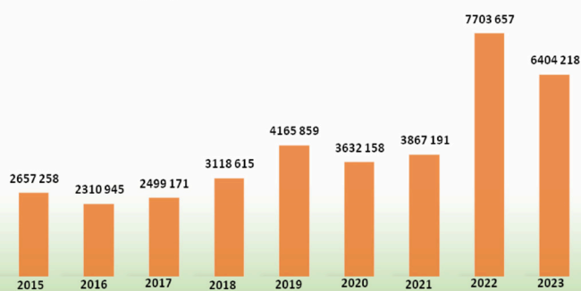
Výdavky obce 2015 - 2023