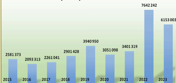
Prebytky v hospodárení obce 2015 - 2023