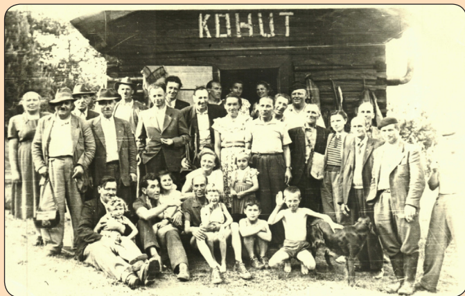
Chata Kohút rok 1953.