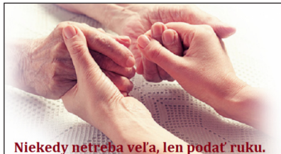
Niekedy netreba veľa, len podať ruku.

Starnutie je zákonitý, nezvratný a prirodzený proces. Mesiac október sa nesie v duchu úcty k našim starým rodičom, susedom, priateľom aj známym, preto by mal byť pre nás všetkých pripomienkou, že si treba uctiť starších ľudí v našom okolí. V decembri 1990 bol mesiac október vyhlásený Valným zhromaždením OSN